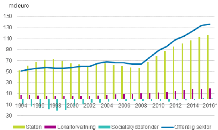
Figurbilaga 1. Bidraget av den offentliga sektorns undersektorer till den offentliga sektorns skuld, md euro 1994–2016