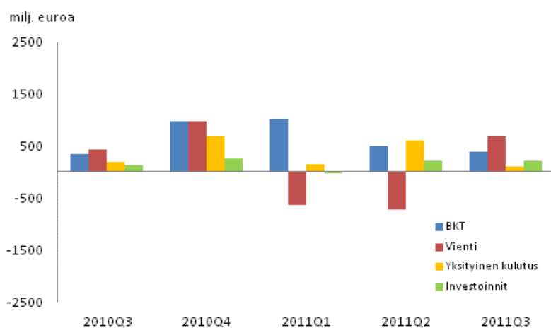
Kuvio 2. Bruttokansantuotteen ja kysyntäerien muutokset edellisestä neljänneksestä (kausitasoitettu, käyvin hinnoin)

Viennin volyymi kasvoi heinä-syyskuussa 2,4 prosenttia edellisestä neljänneksestä, mutta oli 2,7 prosenttia pienempi kuin vuosi sitten. Tavaroiden vienti kasvoi 3,5 prosenttia edellisestä neljänneksestä ja palveluiden vienti 2,7 prosenttia. Tuonnin volyymi väheni 1,7 prosenttia edellisestä neljänneksestä ja oli 7,1 prosenttia pienempi kuin vuosi sitten. Tavaroiden tuonti väheni 1,5 prosenttia edellisestä neljänneksestä ja palveluiden tuonti 1,8 prosenttia.