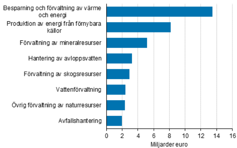
Figurbilaga 1. Omsättning inom miljöaffärverksamhet 2017, miljarder euro